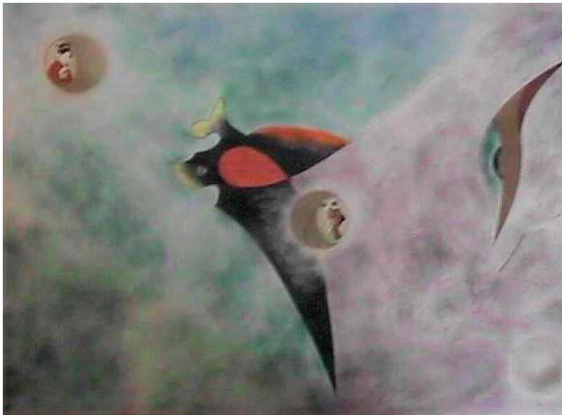
gianpaolo salbego, tokyo 1998