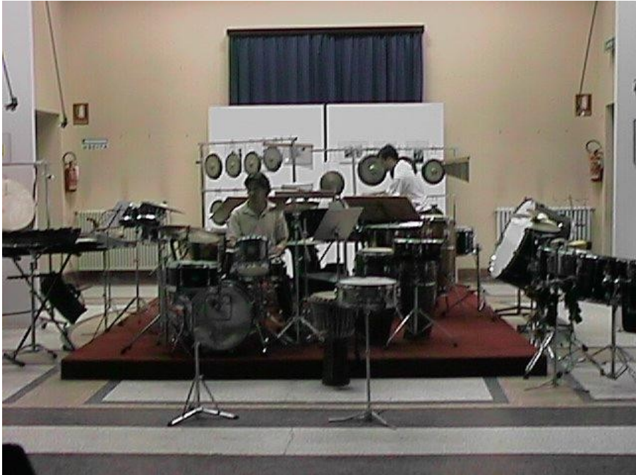
Octandre is percussion , 2000 (Massimo Cappa, Andrea Fari)